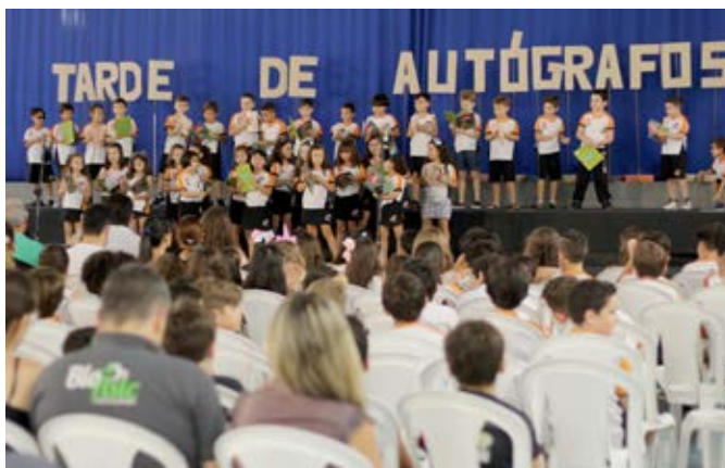
Alunos do Ensino Fundamental I do Curso G9 encerram atividades do Projeto Literatura com Tarde de Autógrafos, que reuniu pais e familiares; evento teve apresentações teatrais, preparadas pelas professoras