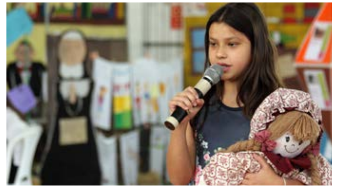
Desenhos, teatro, dança e música: maneiras encontradas pelos alunos para a apresentação dos trabalhos

querência e determinação para completar seus desafios e conquistar seu objetivo, ou seja, transpor a travessia como exemplo para a nossa vida. 🗨️