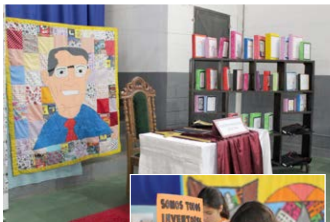
Olhar de encanto pelas palavras, pela vida e pela obra expostas nos corredores e no ginásio do Curso G9