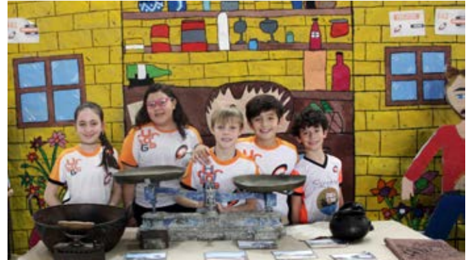
Teve venda do seu Fulô, fogão de lenha e muitas canções nas Saídas Musicais da Educação Infantil e Ensino Fundamental I