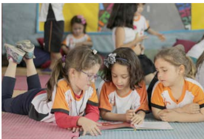
Exposição agradou visitantes e comunidade escolar pela criatividade e empenho dos alunos

curiosa, observadora, grande leitora, características tão reais para os pequenos da Educação Infantil, que se tornaram grandes conhecedores da vida dele. E num caminhar de A a Z, conheci mais sobre a vida deste grande escritor, seguindo as informações do 3º ano. Que trajetória de vida empolgante! Experimentei a sua infância bem vivida entre as formiguinhas, bois de sabugo de milho e me coloquei no lugar dele, no quintal divertido criado pelos alunos do 1º ano. Infância repleta de brincadeiras e de